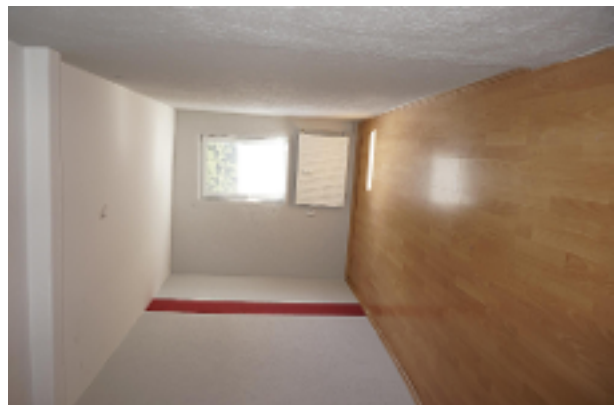
kleines Zimmer oben